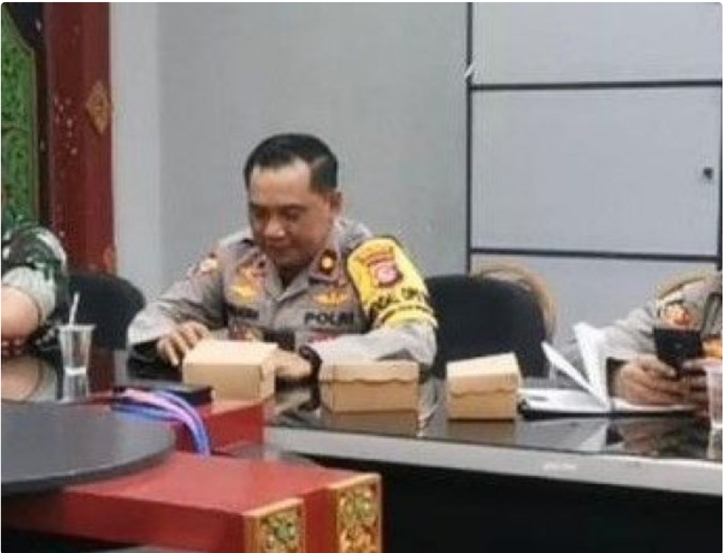
Kabagops Polresta Mataram saat menghadiri Rakor di Kantor Bupati Lombok Barat, Selasa (10/12/2024)

MATARAM, NTB – Dua tradisi budaya ikonik, Pujawali dan Perang Ketupat, akan