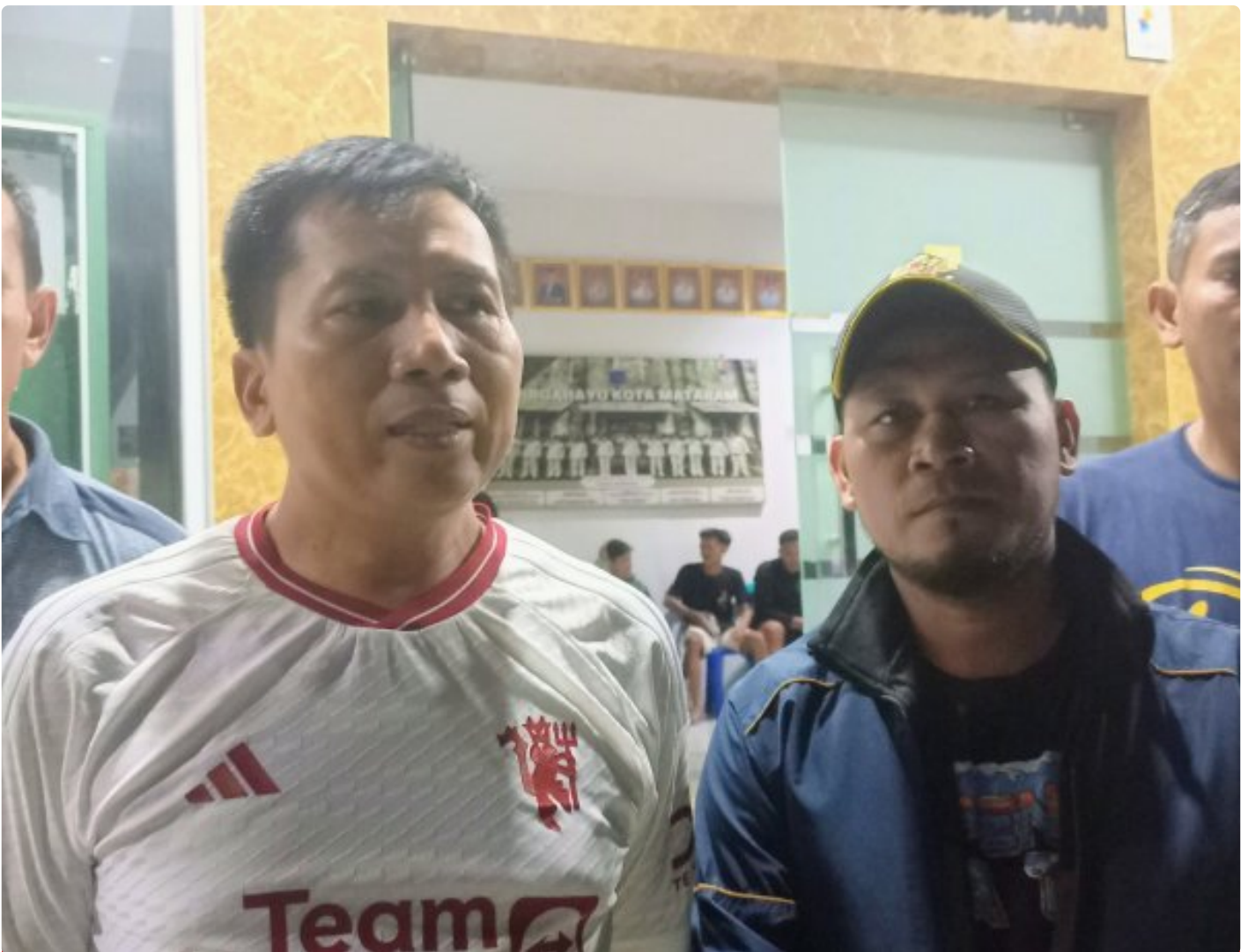
Kapolsek Ampenan didampingi Danramil, Camat Ampenan serta Lurah Ampenan timur.

Mataram NTB - Respon cepat Polsek Ampenan, Koramil Ampenan dan Pemerintah Kecamatan Ampenan mengambil langkah antisipasi terhadap kesalahpahaman yang terjadi antara kelompok pemuda warga lingkungan